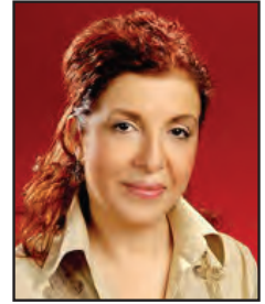
Günseli Kılınç Dış İlişkiler Komitesi Başkanı